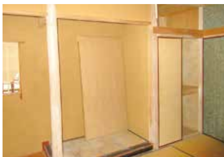
リフォーム前の住宅