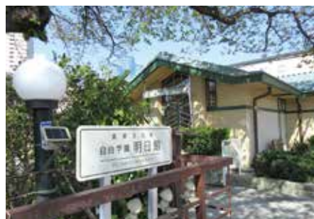
重要文化財建築の明日館がお散歩コース