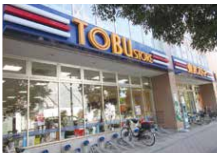
近くのスーパー・ドラッグストアまでは徒歩5分